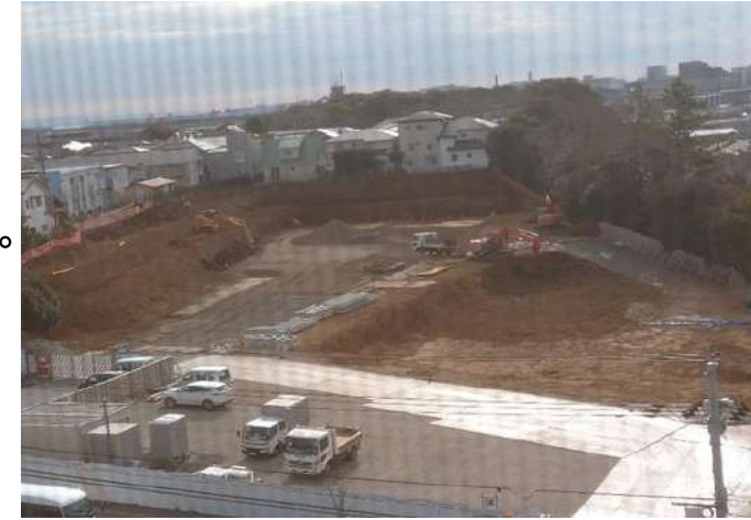
解体作業が進む旧庁舎跡地 (令和4年2月撮影)

昭和48年に築造された鷺沼西跨線橋は、平成27年度から順次補修及び耐震補強工事が進められてきました。現在はJR総武線上空部分の工事が進められています。