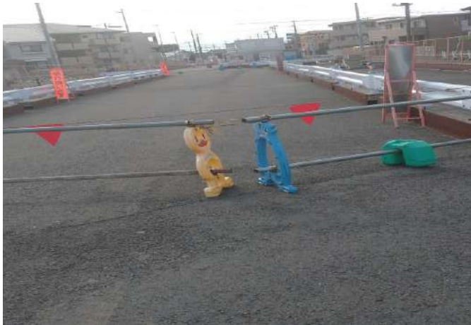
都市計画道路3・3・3号藤崎茜浜線 (令和4年2月撮影)

東日本大震災ののち旧庁舎は閉鎖され、仮庁舎を経て、平成29年4月末に新庁舎が完成、移転しました。現在、旧庁舎は解体作業が進められており、跡地活用についての検討が進められています。