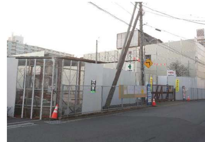
解体作業が進む旧学校給食センター (令和4年2月撮影)

学校給食センターは平成31年4月に芝園に移転しました。旧施設(津田沼3丁目)は解体作業が開始され、跡地に菊田第二保育を移転し、民間へ移管する計画が進められています。新たな保育所は令和6年度の開設予定です。