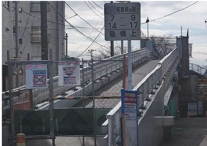
鷺沼西跨線橋(さぎぬまにしこせんきょう) (令和4年2月撮影)

昭和48年に築造された鷺沼西跨線橋は、平成27年度から順次補修及び耐震補強工事が進められてきました。現在はJR総武線上空部分の工事が進められています。